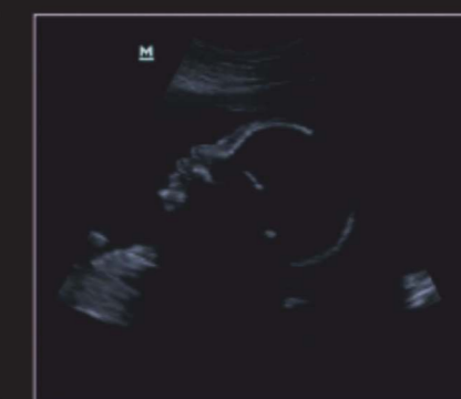
Профиль лица плода