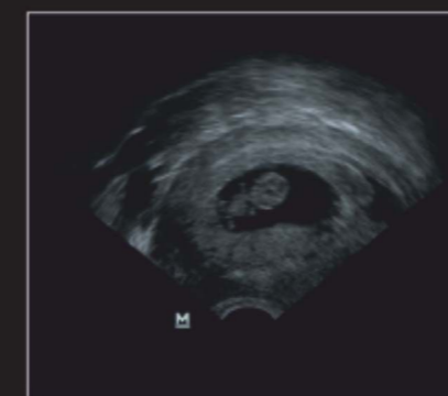
Зародыш на ранних сроках