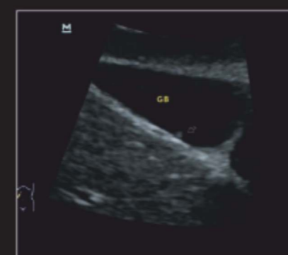
Полип желчного пузыря