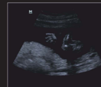
Пальцы кисти плода